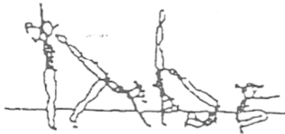
Apoio facial invertido, rolamento à frente (20%)

Construa uma sequência, com as diversas figuras, de forma a obter no mínimo 60% de média do valor global dos elementos técnicos.