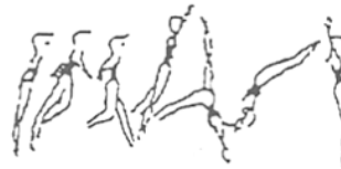
Salto de mãos à frente (10%)