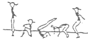
Rolamento à retaguarda (10%)