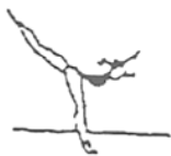
Posição de equilíbrio (5%)