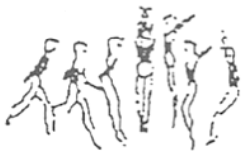
Corrida e salto em extensão com 1/2 volta (5%)